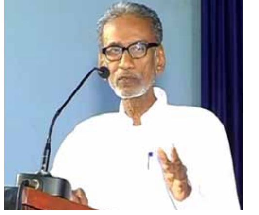
(பழ. நெடுமாறன்) தலைவர்

கொரோனா தொற்று பரவுவதற்கு கோயம்பேடு சந்தை முக்கிய காரணமாக இருந்ததால் அதை முடிவது போல மதுவினால் ஏற்படும் சமூகச் சீரழிவிற்கு காரணமான மது உற்பத்தி சாலைகளை மூடுவதற்கு அனைவரும் இணைந்து போராட முன் வர வேண்டுமென வேண்டிக்கொள்கிறேன்.