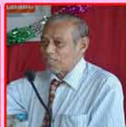
ஐவாத் மரைக்கார் (இலங்கை)