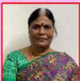
அ. தமிழரசி (தமிழ்நாடு)