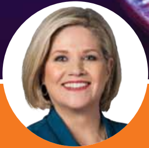
Andrea Horwath Leader of the Official Opposition