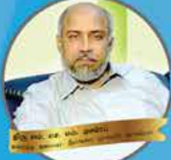
இலங்கை திரு. சி. சி. செந்தில்குமார் இலங்கை, கனடா