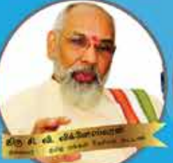
இலங்கை திரு. சி. சி. செந்தில்குமார் இலங்கை, கனடா