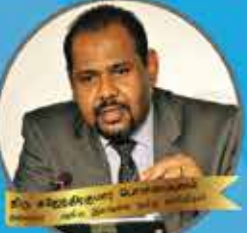
இலங்கை திரு. சி. சி. செந்தில்குமார் இலங்கை, கனடா