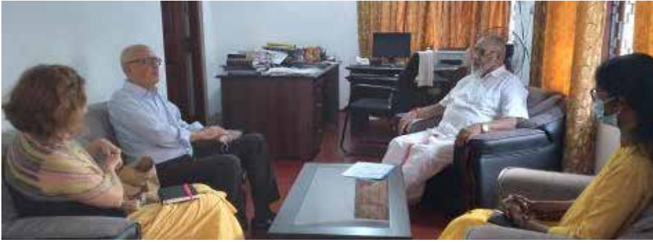
சுவிற்சர்லாந்து தூதுவருடனான சந்திப்பு தொடர்பாக யாழ் மாவட்ட பாராளுமன்ற உறுப்பினரும், நீதியரசருமான க.வி.விக்னேஸ்வரன் நேற்று முன்தினம் புதன்கிழமை மாலை ஊடக அறிக்கை ஒன்றை விடுத்துள்ளார்.

-குறித்த அறிக்கையில் மேலும் தெரிவிக்கையில்,,