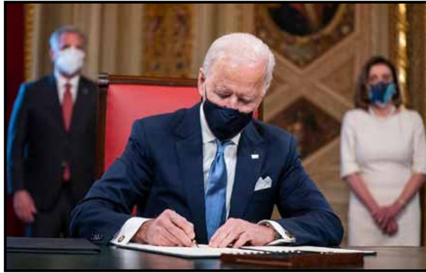
கிளிண்டன் 3 உத்தரவுகளிலும்

பதவியேற்ற முதல் நாளில் டிரம்ப் 8 உத்தரவுகளில் கையெழுத்திட்டார். ஓபாமா 9 உத்தரவுகளில் கையெழுத்திட்டார். ஜார்ஜ் டபிள்யூ புஷ் 2 உத்தரவுகளிலும் கையெழுத்திட்டனர்.