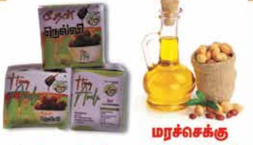
தேன் நெல்லி மரச்செக்கு எண்ணெய்கள்