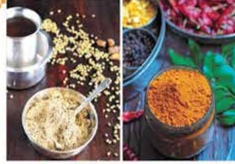
சுக்கு மல்லி காயி தூள் யாழ். கறித்துள்

இலங்கை மற்றும் தென்னிந்திய மசாலா பொருட்கள் பாரம்பரிய உணவு வகைகள்..