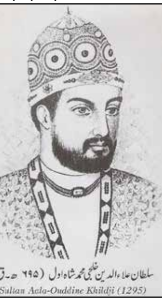
Sultan Ala-Uddine Khilji (1295)

பதவிப் பிரமாணம் செய்து வைக்க வேண்டிய இடைக்கால ஆளுநர் காணாமல் போய்விட, சசிகலா மலர்ச்சி கொடுத்துகளை வாங்கும் நிகழ்ச்சிகள் மட்டும் தொடர்ந்தன. கடைசியில், 7-8 மாதங்களாக தூங்கிக் கொண்டிருந்த கோண்டிருந்த தீர்ப்பை தாசி தட்டி எடுத்து, சசிகலாவுடைய பெங்களூர் பார்ப்பன அக்கிரகாரத்து சிறையில் தள்ளினார். தனக்கு அடுத்த