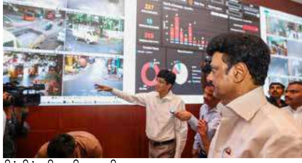
சிக்கித் திணறி வருகிறது.

இதற்கிடையே, வங்கக்கடலில் நிலவும் ஆழ்ந்த காற்றழுத்த தாழ்வுபகுதி மற்றும் இலங்கை அருகே நிலவும் வளிமண்டல கீழடுக்கு சுழற்சி காரணமாக கடந்த 29ம்தேதி காலை முதல் இரவு வரைசென்னை மற்றும் புறநகர் பகுதிகள் உட்பட மாநிலத்தின் பல்வேறு பகுதிகளிலும் கனமழை கொட்டித் தீர்த்தது. சென்னையில் பெய்த கனமழையால் 192 இடங்களில் மழைநீர் தேங்கியது. மேற்கு மாம்பலம், கொளத்தூர் உள்ளிட்ட பல்வேறு பகுதிகளில் வீடுகளுக்குள் மழைநீர் புகுந்ததால் மக்கள் கடும் அவதிக்கு உள்ளாகினர். பல குடியிருப்புகளை வெள்ள நீர் சூழ்ந்தது. ஏராளமான சாலைகளில் மழை நீர் வடியாததால், 29ம் தேதி இரவு முதலே சென்னை மாநகரம் போக்குவரத்து நெரிசலில்