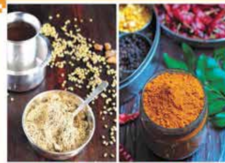
சுக்கு மல்லி காபி தூள்