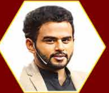
Actor/ Singer / MC Vijay