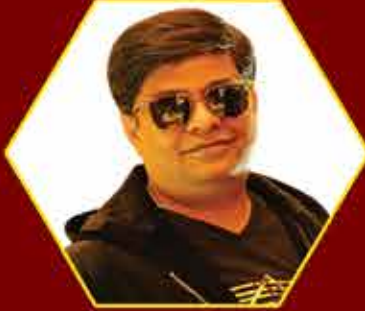
Music Mathan Band