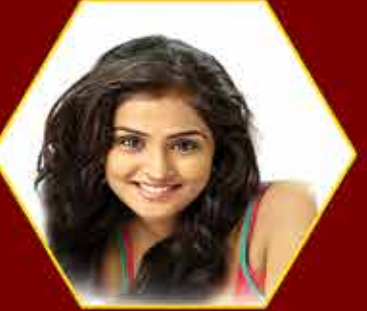
Actress/ Singer Rammiya Nambeesan