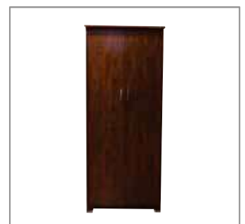
2 Door Wardrobe $399 $249