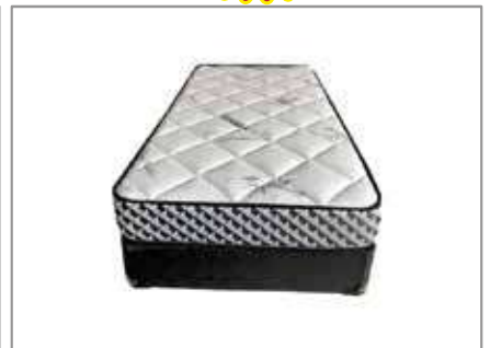
Dreamopedic Single Mattress $249 $149