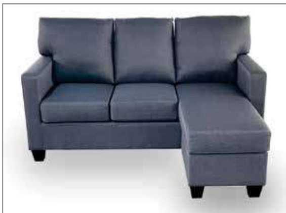
ANG L Sofa Grey & Brown $650 $399