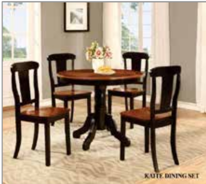
5pcs Dining Table $799 $499