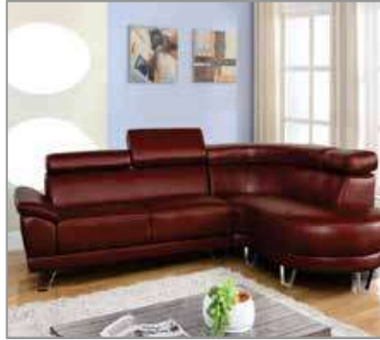
JANE Sectional (Bk-WH-RD) $1699 $1299