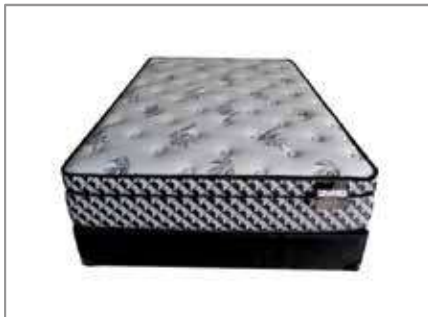
Velvet Rose Queen Mattress $399 $299