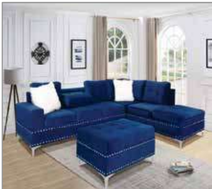
MOREN Sectional Sofa $1249 $899