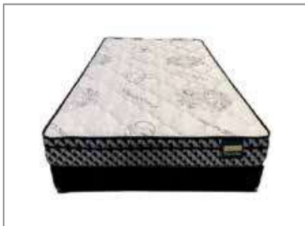
Queen Diamond Firm Mattress $499 $299