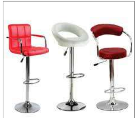
Bar Stool $99 $59