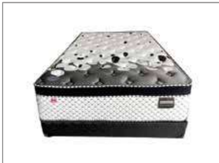
Back Support Queen Mattress $799 $549