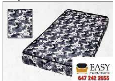
5" Foam $79 $59