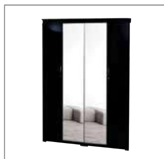
4 Door Wardrobe $899 $599