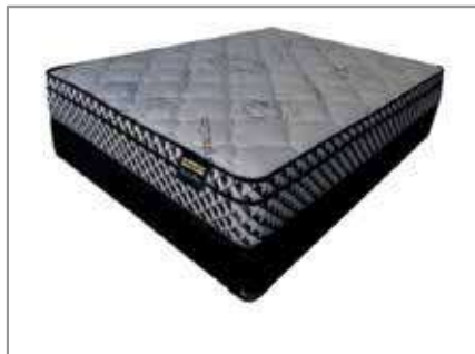
Rest-O-Pedic Queen $399 $249