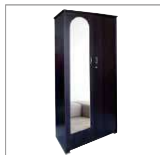
2 Door Wardrobe With Glass Mirror $449 $349