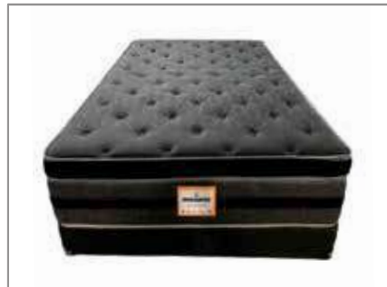
Spine Comfort Queen Mattress $699 $499