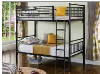
S/S BUNK Bed (Grey) $799 $399