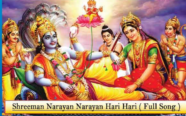
Shreeman Narayan Narayan Hari Hari ( Full Song )