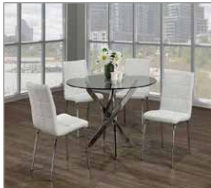
5 pcs Dining Table $799 $499