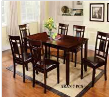
7 pcs Dining Table $799 $549