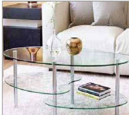
Coffee Table $149 $99