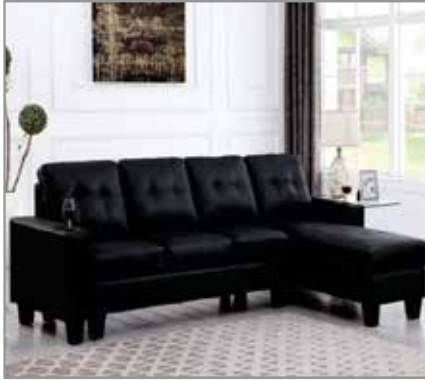
REM L Sofa $699 $499