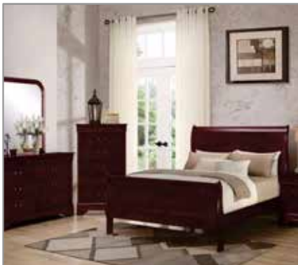
EF QUEEN Bedroom Only $999 $799