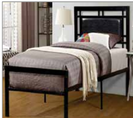
Single Bed $199 $149