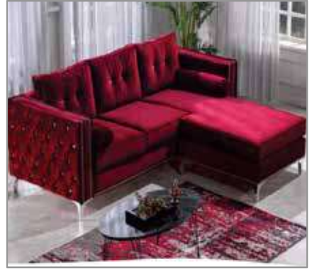
UG RED Sectional $1199 $899