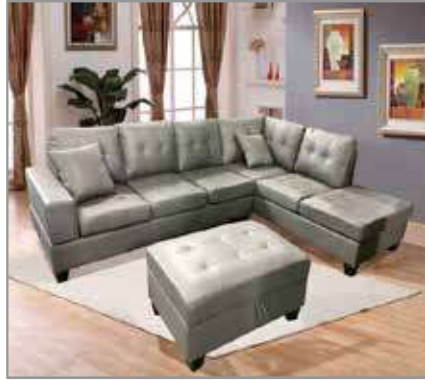
SAIL Sectional (with ottoman) $1299 $899