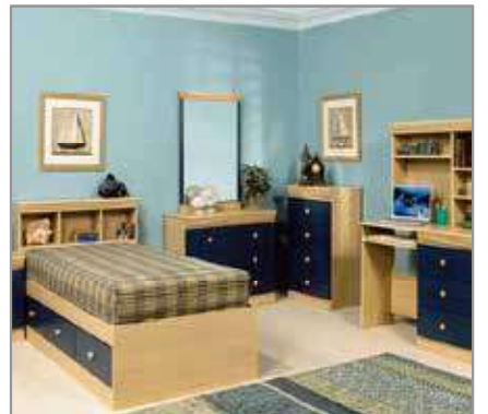
6 pcs Bedroom $899 $599