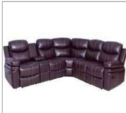
Easy Air Leather Corner Sofa $2499 $1999