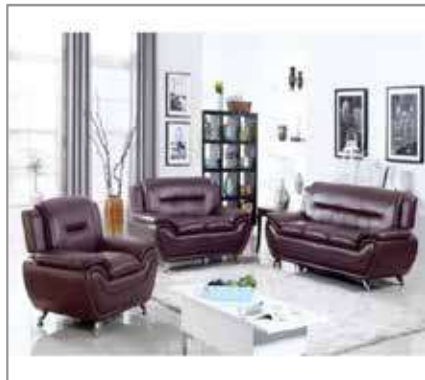
GRASSY 3 pcs Sofa $1199 $899