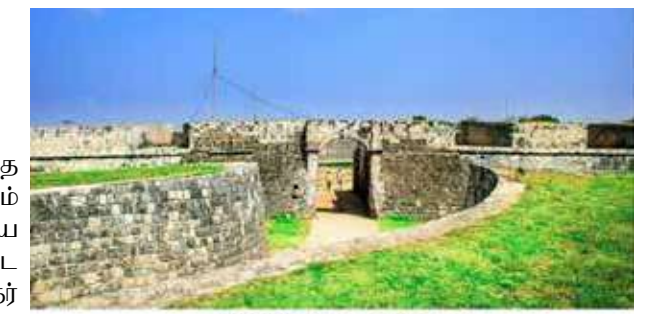
ஓலந்தர் கோட்டை - யாழ்ப்பாணம்

இதேவேளை தொல்பொருள் திணைக்களமும், மத்திய கலாசார நிதியமும் மாகாண சபையுடன் இணைந்து செயற்படும் போது, அதற்கான ஒத்துழைப்புகளை வழங்க முடியும் என ஆளுநர் கூறினார். ஆளுநரின் பணிப்புரைகளை ஏற்றுக்கொண்ட அதிகாரிகள், பணிப்புரையை துரிதமாக செயற்படுத்த நடவடிக்கை எடுப்பதாகவும் தெரிவித்தனர்.