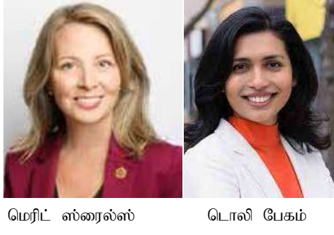
மெரிட் ஸ்ரைல்ஸ் டொலி பேகம்

நேற்று 27ம் திகதி வியாழக்கிழமையன்று நடைபெற்ற கனடாவின் ஒன்றாரியோ மா-காணத்திற்கான தேர்தலில் பெரும்பான்மையான வாக்காளர்கள் டக் போர்ட் அவர்களை முதல்வராகக் கொண்ட கொண்ட கொண்சர்வேர்ட்டில் கட்சி அரசாங்கத்தை பெரும்பான்மைப் பலத்தோடு மீண்டும் ஆட்சியில் அமர்த்தியுள்ளார்கள். நடைபெற்று முடிந்த தேர்தலில் ஆளும் கட்சியாக "குயின்ஸ்பார்க்" மாகாணப் பாராளுமன்றத்தில் விளங்கப்போகும் கொண்சர்வேர்ட்டில் கட்சி மொத்தம் 124 ஆசனங்களில் 81 ஆசனங்களைக் கைப்பற்றி பெரும்பான்மை அரசாங்கத்தை அமைக்கும் மக்கள் அணையைப் பெற்றுள்ளது. மேலும், மீண்டும் இயங்கவுள்ள ஒன்றாரியோ குயின்ஸ்பார்க் பாராளுமன்றத்தின் பிரதான எதிர்க்கட்சியாக விளங்கவுள்ள