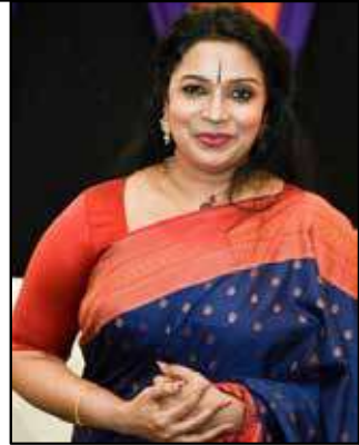
Students of Srimathi